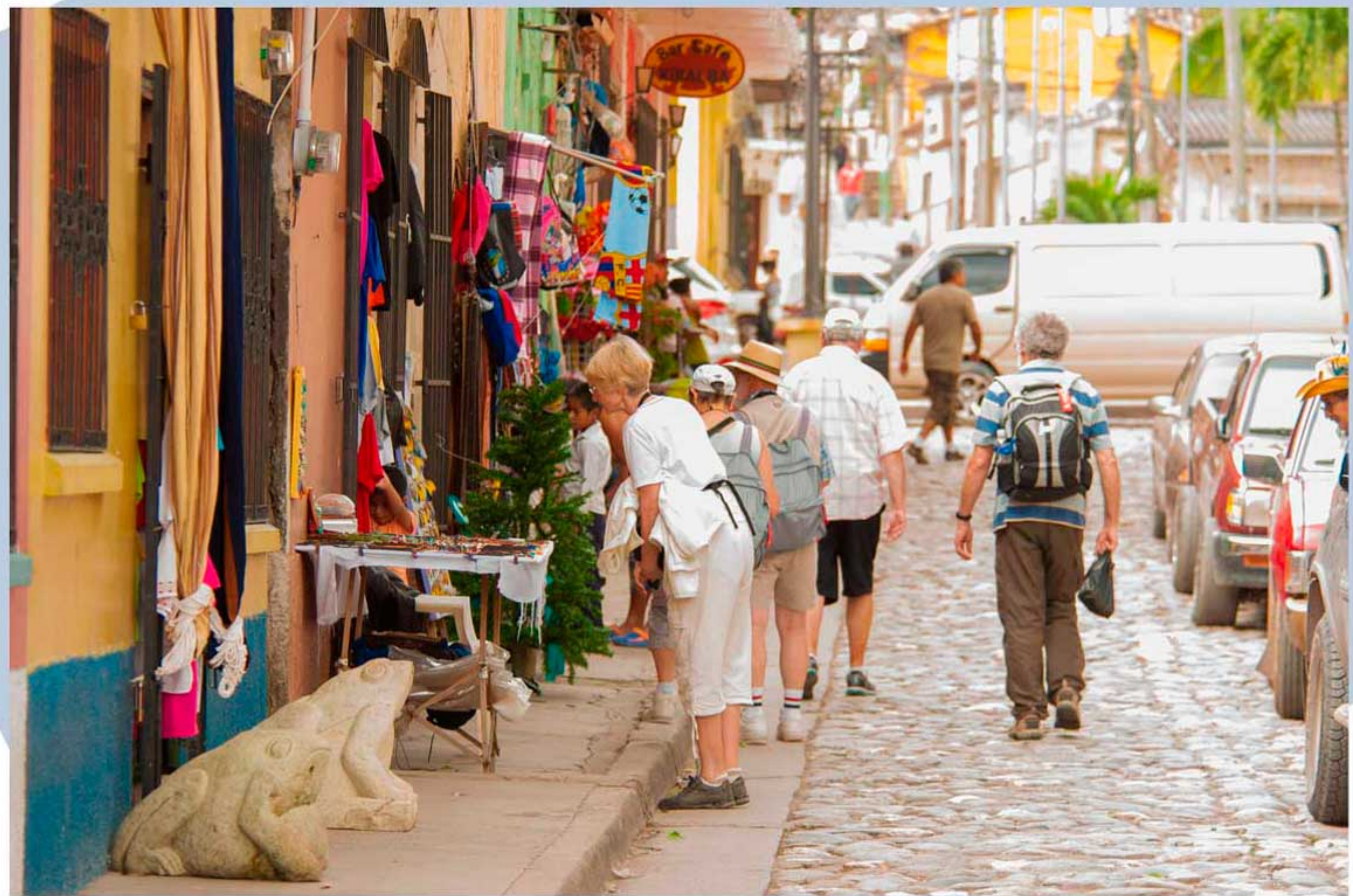
Copán Ruinas, es uno de los polos turísticos de la región, es visitado por turistas de todo el mundo

La Comisión Trinacional del Plan Trifinio (CTPT), a través de los esfuerzos del Programa Ordenamiento y Desarrollo del Turismo Sostenible en la Región Trifinio PROTUR, en alianza con el BID-FOMIN, realizan el lanzamiento la Ruta Trinacional de Turismo Sostenible (RTTS). Se busca promover el desarrollo turístico de la región, tomando en cuenta los valores y atractivos más representativos, entre los que se destacan, la arqueología, historia, gastronomía, arquitectura, naturaleza, cultura, artesanías, y el folklóre.