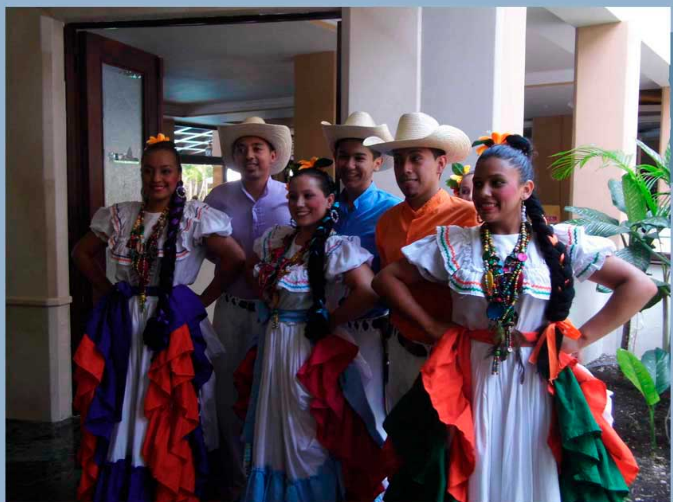
Estampa folclórica de Ocotepeque, Honduras, presentes durante la firma del Convenio.