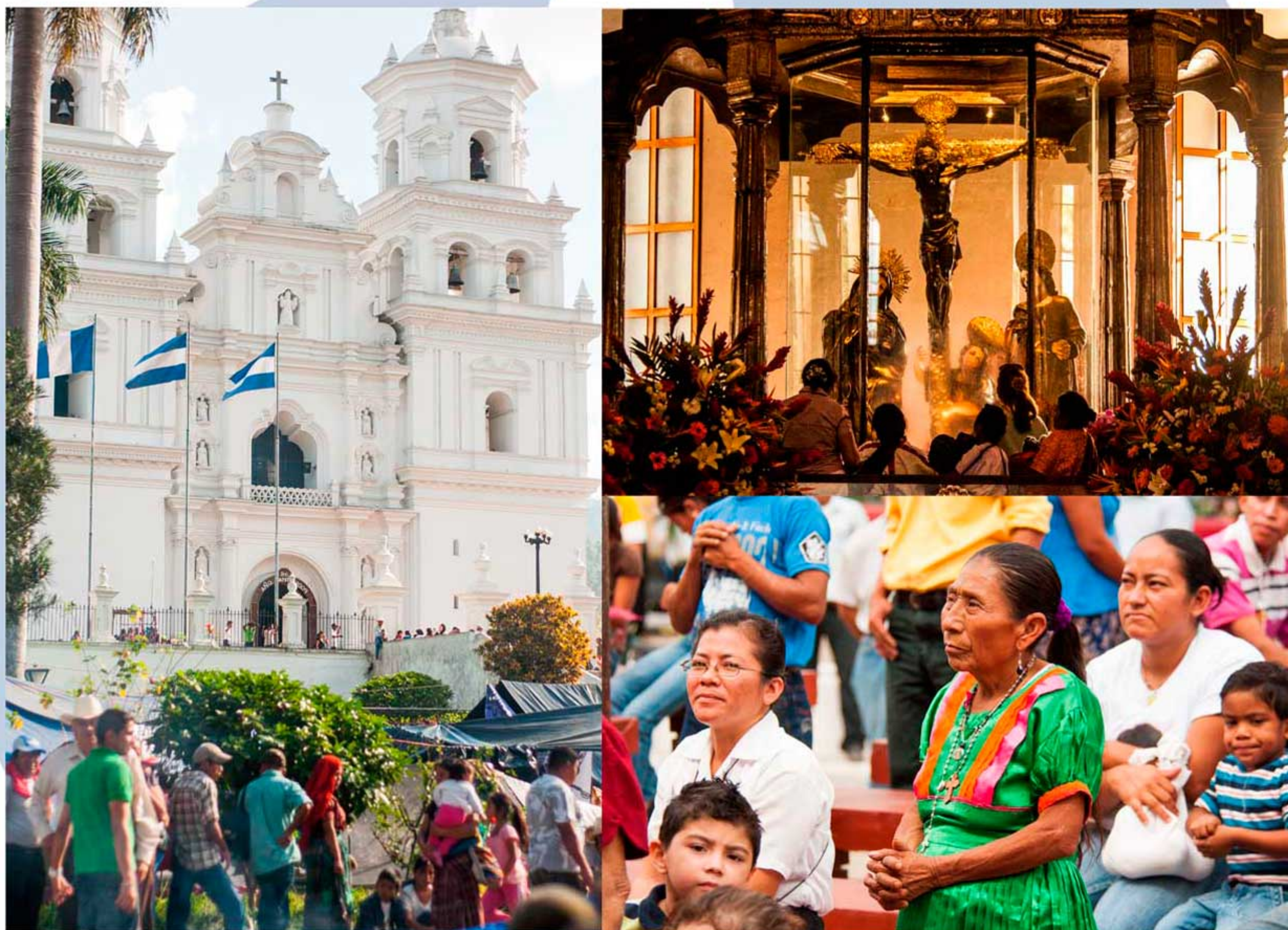
Basilica del Cristo Negro de Esquipulas, es parte de la riqueza cultural ancestral de la RTTS

La Ruta Trinacional de Turismo Sostenible RTTS, tiene como propósito integrar los 135 atractivos turísticos de mayor potencial en los 45 municipios que forman parte de la Región Trifinio, por medio de circuitos turísticos que configuran una oferta temática diversa y de calidad en sus servicios. En su recorrido podrá disfrutar hermosos y emblemáticos atractivos, de los tres países en poco tiempo.