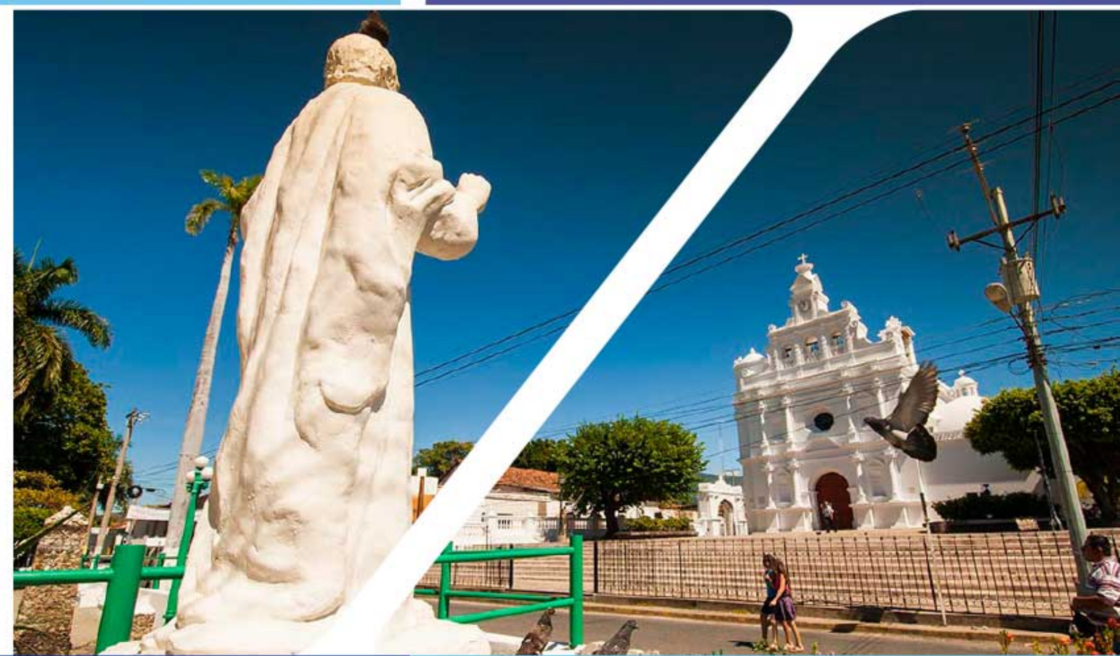
Imágenes de la Ruta Turística de la Región Trifinio