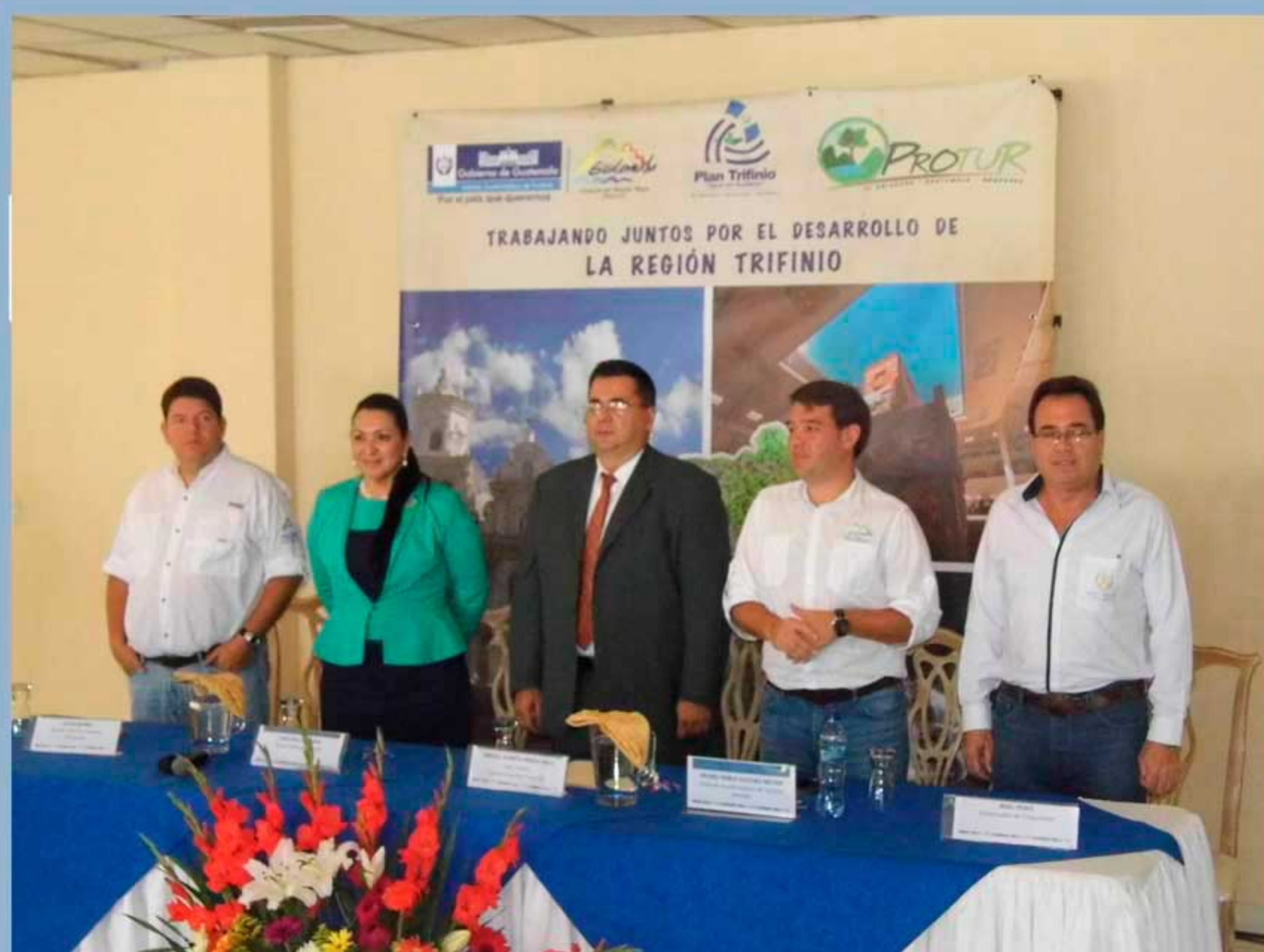
Mesa principal durante la firma, integrada por los gobernadores de Chiquimula y Zacapa, autoridades de Plan Trifinio e Inguat.

Por su parte el Secretario Ejecutivo Trinacional del Plan Trifinio, Miguel Pineda informó que mas de mil micro, pequeños y medianos empresarios del sector turístico en la zona compartida entre El Salvador, Guatemala y Honduras, participan en el desarrollo de un ambicioso proyecto para establecer la Ruta Trinacional de Turismo Sostenible que integre los servicios turísticos para poner al alcance, los principales atractivos del patrimonio natural y cultural representativos de dicha región