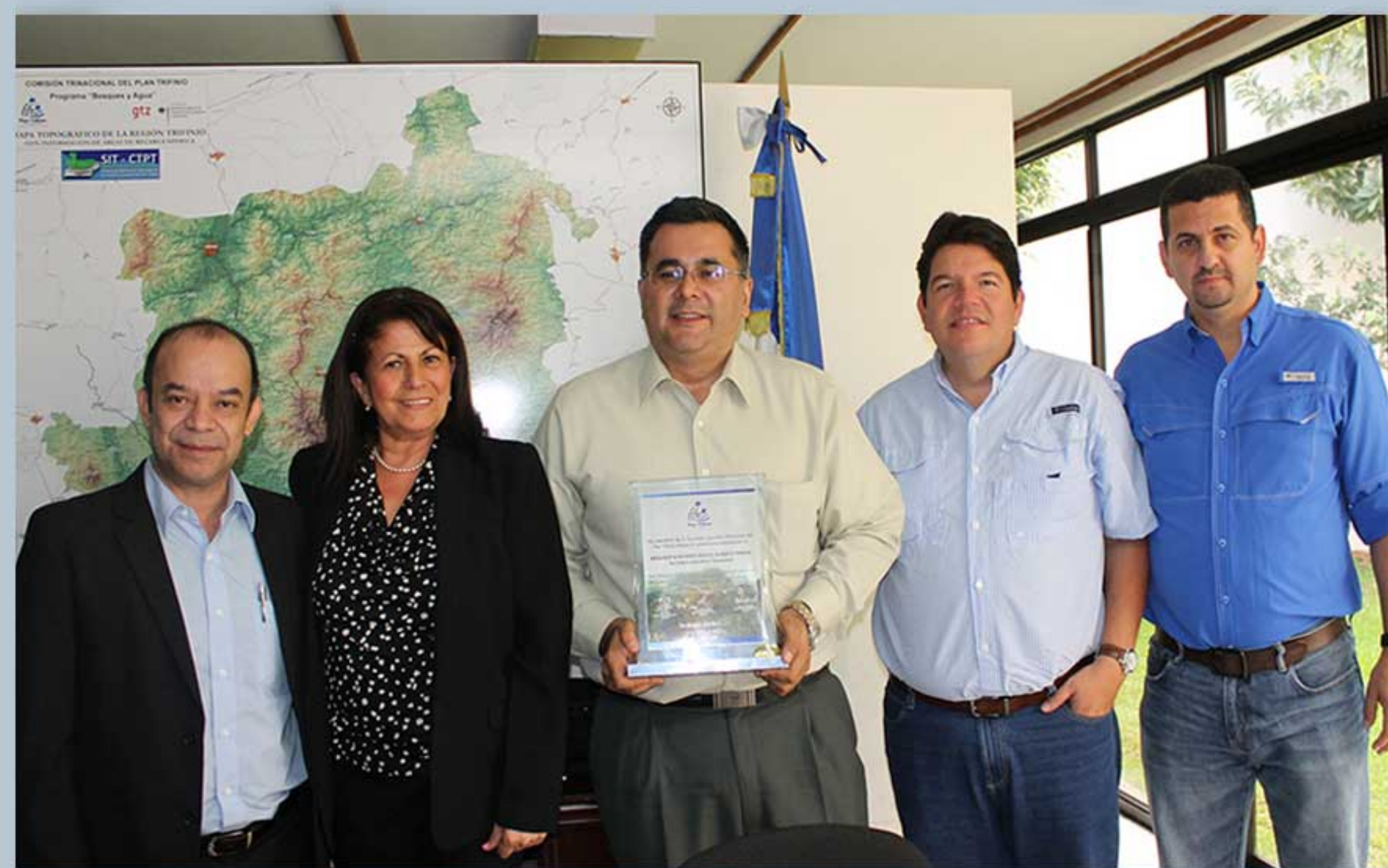
Miembros de la Secretaría Ejecutiva Trinacional del Plan Trifinio/ Período 01/Julio /2010 al 30/Junio/2014

El informe resalta una inversión durante 4 años de más de 28 millones de dólares en la región del Trifinio, con fondos provenientes de los Gobiernos, así como de la cooperación internacional; además destaca grandes logros como la Declaratoria de Reserva de Biosfera por parte de la UNESCO para esta región; así como la aprobación de un financiamiento por 11 millones de Euros de parte de la Cooperación Alemana a través de KFW.