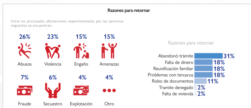
Imagen 1. Motivos de retorno desde México a países centroamericanos de origen

En la imagen 1, se evidencia las condiciones a las que se exponen los emigrantes centroamericanos; retornados desde México a sus lugares de origen. México es un corredor migratorio al igual que los países centroamericanos, por su posición geográfica, para los migrantes con destino a Estados Unidos.