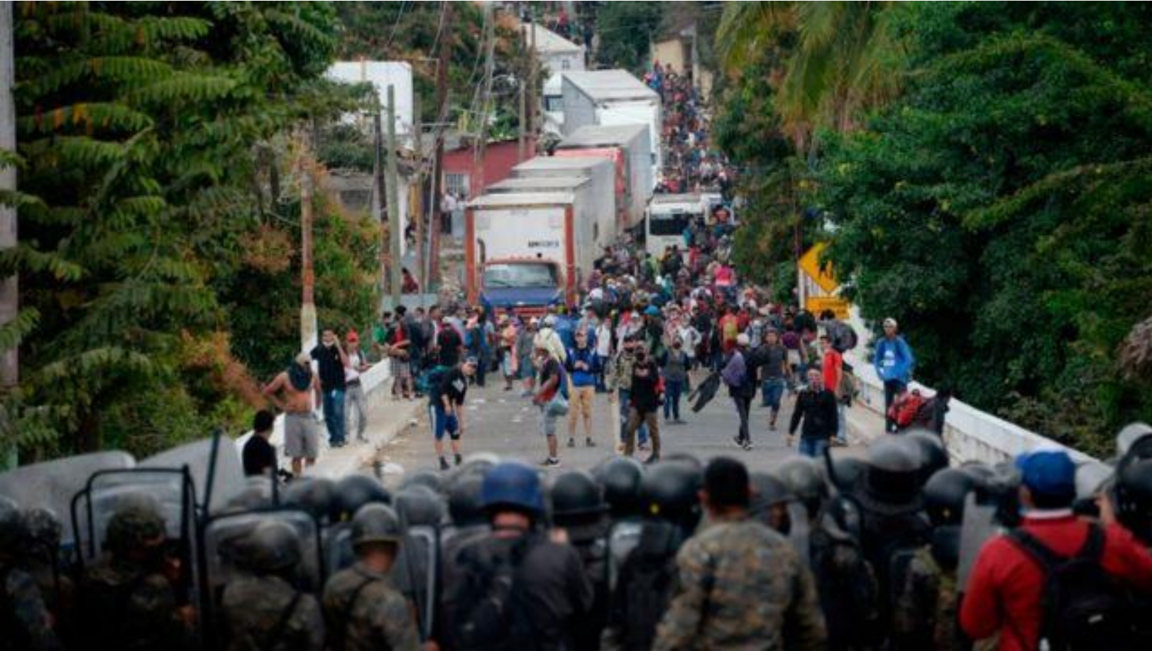
Imagen 2. Caravana de migrantes