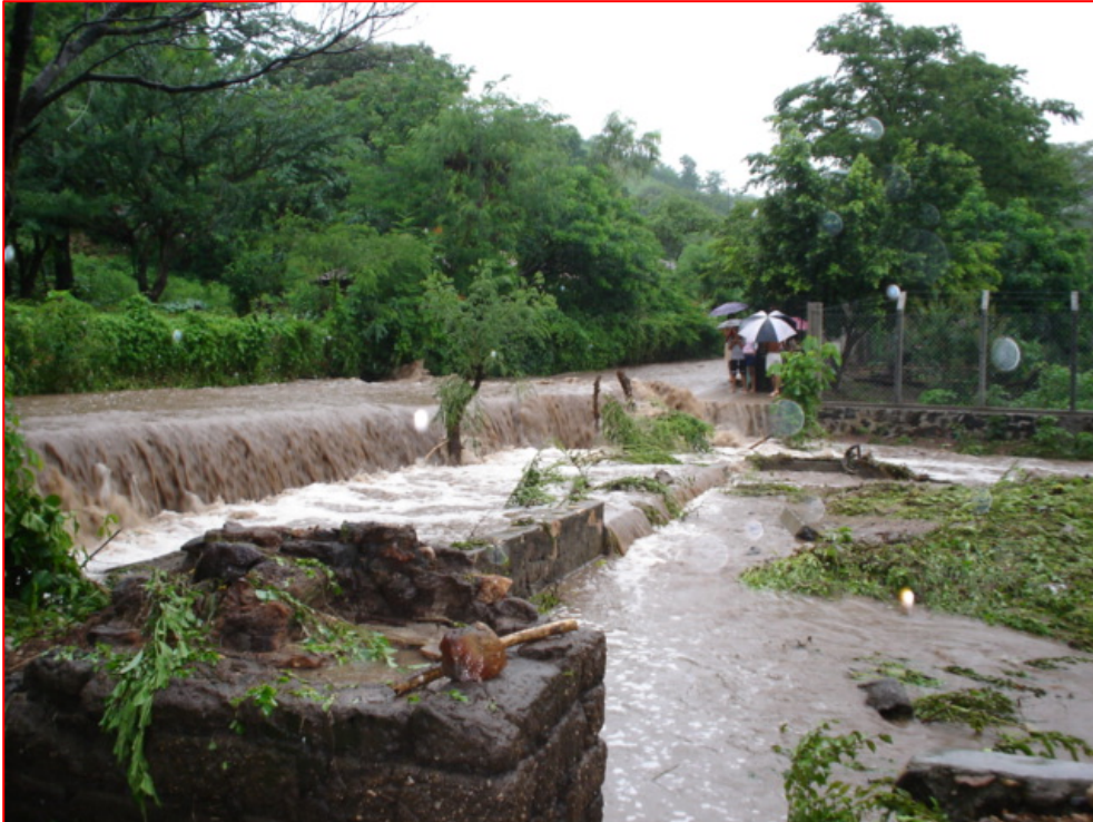
Foto No 7. Panorámica de las inundaciones en la comunidad El Mojón, del cantón La Piedrona. Municipio de San Antonio Pajonal.