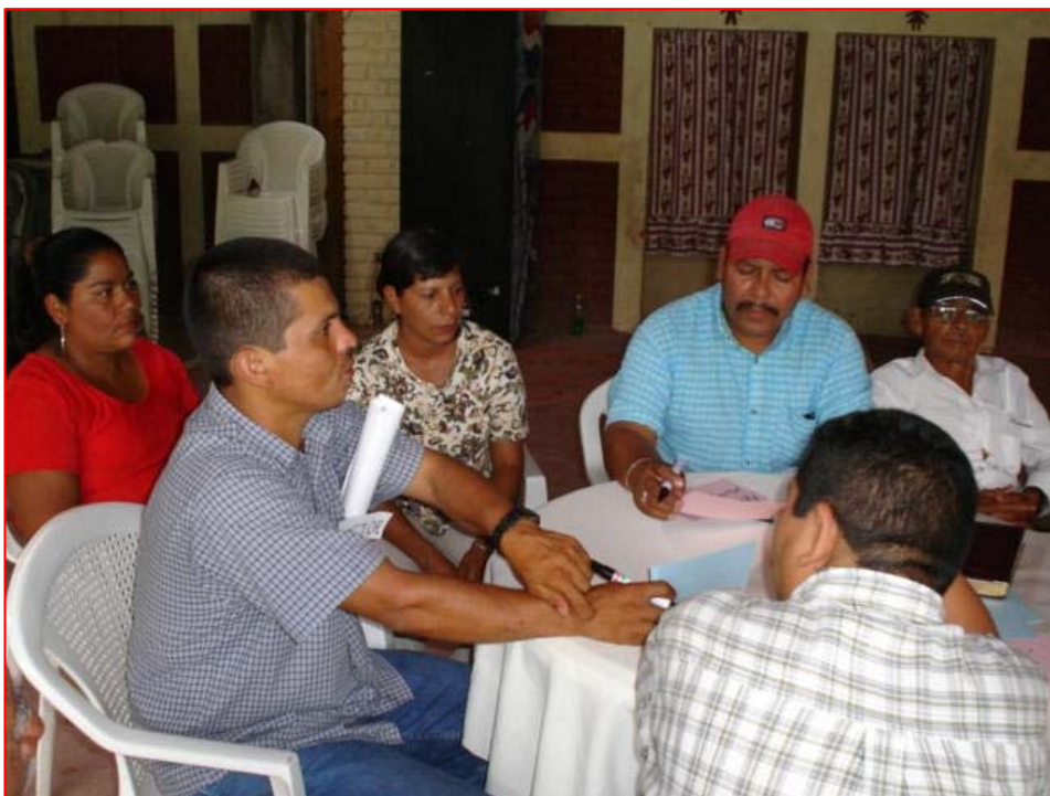
Foto No.4 Taller intermunicipal (Santiago de la Frontera-San Antonio Pajonal) para la priorización de las comunidades con mayor vulnerabilidad identificada.