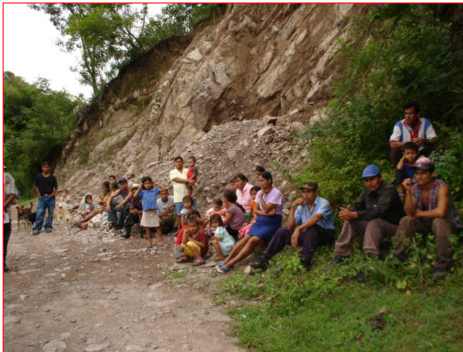
Foto No.2. Comunidad Ojos de Agua, personas participantes del proceso de Diagnóstico Inicial en la subcuenca Cusmapa.