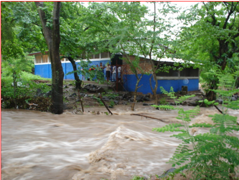
Foto No 8. Afectación del Centro Escolar El Mojón, cantón La Piedrona en San Antonio Pajonal, por efecto de las lluvias intensas.