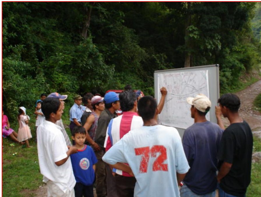
Foto No.1. Trabajo con actores comunitarios en la comunidad Ojos de Agua, Santiago de la Frontera para la identificación de las principales amenazas.