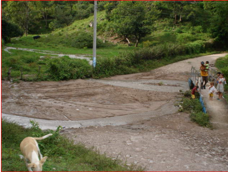
Foto No 5. Panorámica del asolvamiento de las quebradas en la subcuenca Cusmapa en el municipio de San Antonio Pajonal.