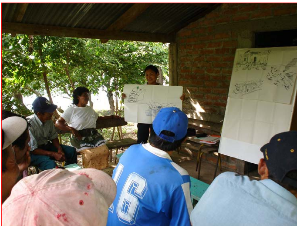
Foto No.3. Discusión de la información recopilada en los recorridos comunitarios y preparada por los miembros de la comunidad Barranquilla. Santiago de la Frontera.