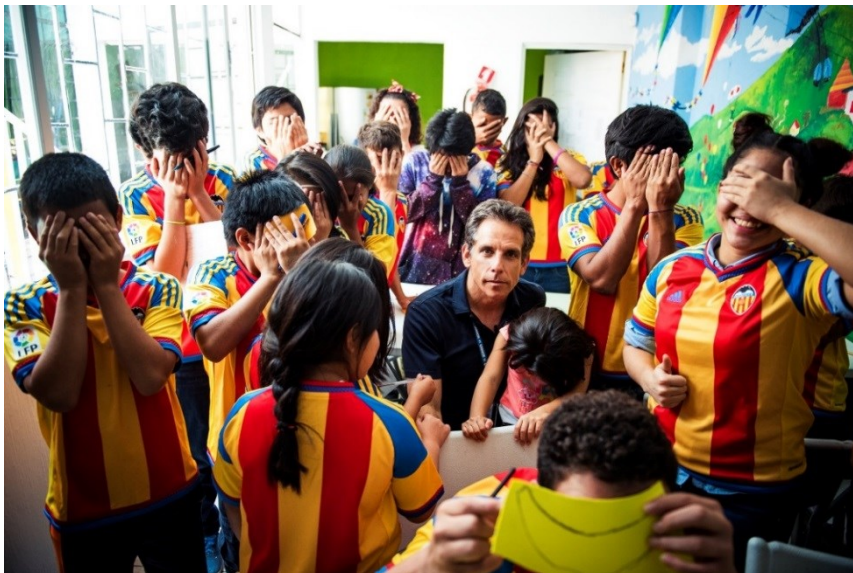
Ben Stiller, Embajador de Buena Voluntad para ACNUR, visita “Raíces de Amor”, un albergue para niños, niñas y adolescentes no acompañados en Ciudad de Guatemala apoyado por ACNUR.

la odisea de las personas que huyen de la guerra, la violencia o la persecución, en muchos casos arriesgando su vida, cruzando mares o caminando miles de kilómetros hasta llegar a un lugar seguro.